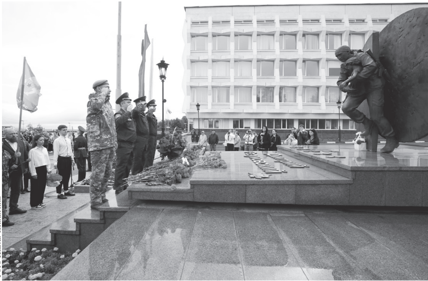
В День солидарности в борьбе с терроризмом в Ульяновске состоялся митинг-реквием у памятника Герою России подполковнику Дмитрию Разумовскому, героически погибшему при освобождении заложников в школе № 1 города Беслана.

Отвечая же на вопрос о том, что было самым главным в эти дни, российский лидер выделил формат работы, позволивший «встретиться в неформальной обстановке и в абсолютно дружеской атмосфере поговорить на любую тему, которая